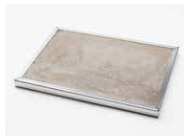
камень для пиццы