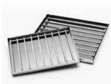
поддон с решеткой