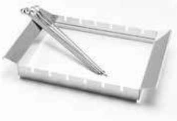
6 шампуров и подставка