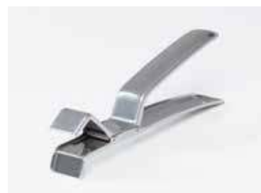
ручка для поддона с решеткой