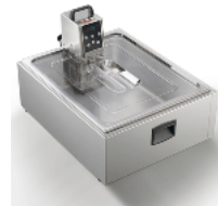
Container 2/1 gastro