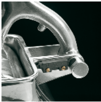
Microswitch on the grater