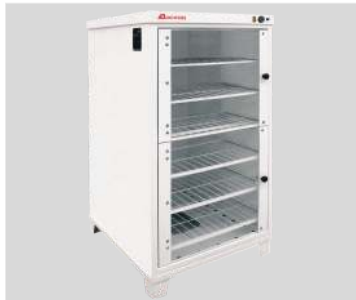
Расстойный шкаф ШРЭ-2.1