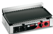
TOP L Timer